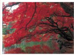
中央公民館の紅葉(10月頃)