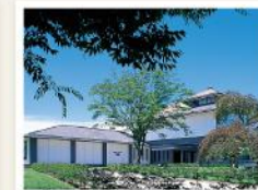
盛岡市先人記念館