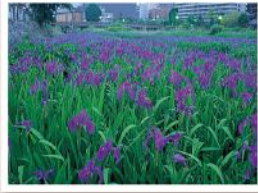
中津川のカキツバタ(5月)