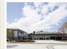
もりおか歴史文化館