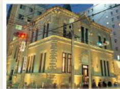
もりおか啄木・賢治青春館