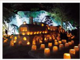
もりおか雪あかり(2月)