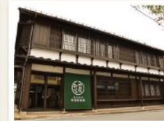
もりおか町家物語館