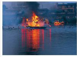
盛岡舟っこ流し(8月)