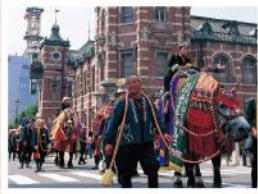
チャグチャグ馬コ(6月)