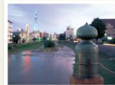
上の橋(擬宝珠)と中津川