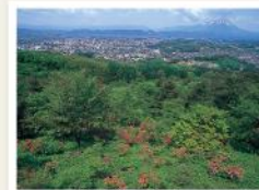
岩山展望台から見た市街地