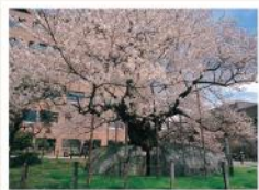
石割桜(国の天然記念物)